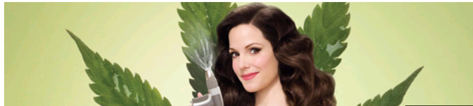
Una imagen promocional de 'Weeds'.